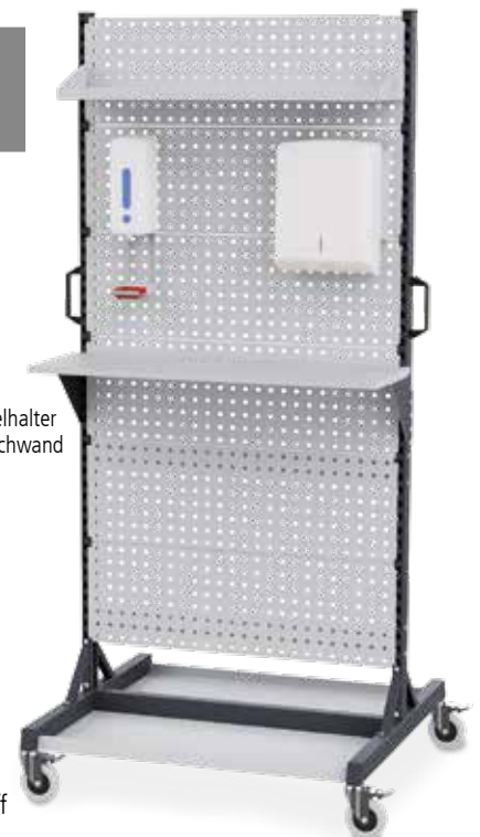
Müllbeutelhalter für die Lochwand s. S. 6